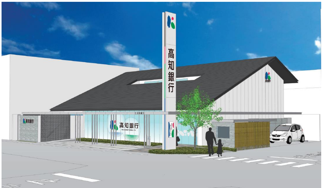
【新店舗のイメージ】