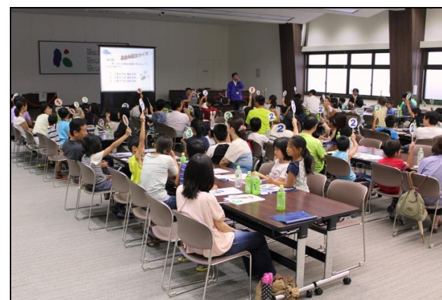
こども金融・科学教室