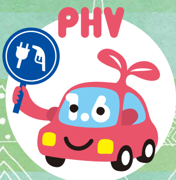
プラグインハイブリッド車

キャンペーン期間：2023年3月31日金まで ※2023年3月31日金までにお申込みの方