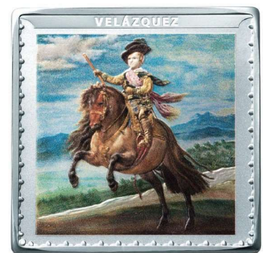
プラド美術館200周年記念コイン