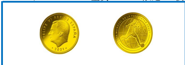
C. スペイン 100ユーロ金貨 限定200枚