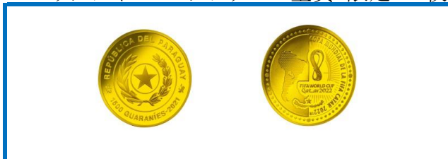
D. パラグアイ 1500グアラニー金貨 限定200枚