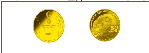
B. フランス 50ユーロ金貨 限定200枚