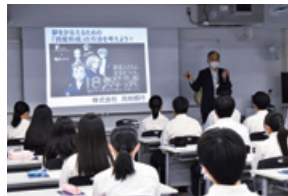
金融教室:高知県立安芸桜ヶ丘高等学校