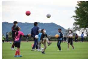
子どもサッカー教室

地域の子どもたちを対象に、高知大学との共催による「子どもサッカー教室」や、金融教育活動の一環として、各種イベントやお仕事体験、金融教室等を開催しております。