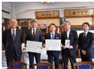
発行企業：株式会社有恒社様 高知県立高知追手前高等学校に寄付金を贈呈

この私募債は、当行が、私募債を発行されるお客さまから受け取る手数料の一部を拠出して、地方公共団体、医療機関、介護・福祉施設や地域の学校等に寄附、または物品の寄贈を行うことが特徴で、その対象先は発行企業さまが選択することも可能です。