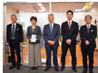
発行企業：サンガリア商事株式会社様 特定非営利活動法人G I F Tに寄付金を贈呈