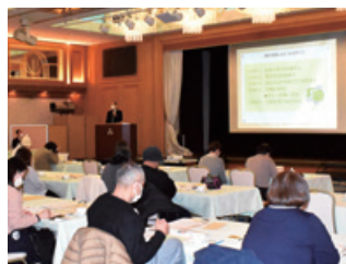
住宅ローン控除の確定申告セミナー