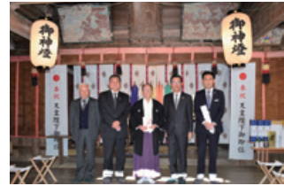
発行企業：ミタニ建設工業株式会社様 宗教法人朝倉神社に寄付金を贈呈