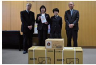
発行企業：株式会社マイ様 愛媛県立新居浜特別支援学校にミシンを贈呈