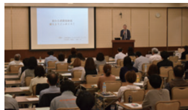
コロナ時代を生き抜くインボイス対策セミナー B S K と共催(2021年11月17日、2022年3月16日)