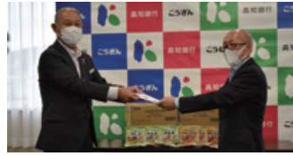
レトルトパウチ食品2種類、合計2,156食 (2021年9月28日)

同協議会は、支援を必要としている個人や施設、団体等に無償で食品を提供する「フードドライブ」の活動を実施されております。