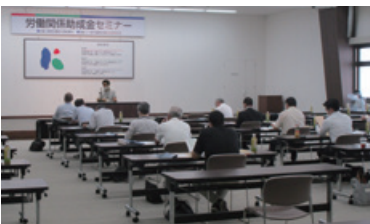
雇用・労働分野関係助成セミナー 高知労働局と共催(2021年7月27日)

当行は、お取引先企業の様々なニーズにお応えしていくため、外部機関との連携による各種セミナーや相談会を開催しております。