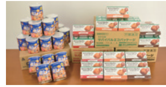
サバイバルパン3種類、3,080箱 ミレービスケット3,381缶 (2022年2月3日)