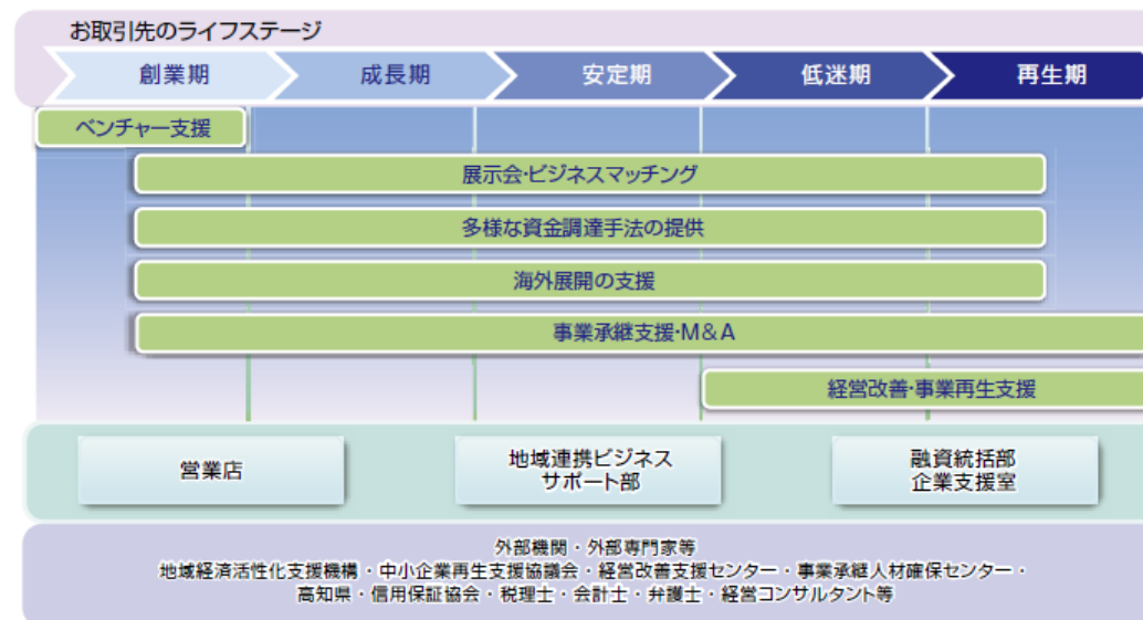
経営支援および外部機関との連携体制

地域連携ビジネスサポート部が主体となって、コンサルティング機能を発揮した地域との連携の更なる強化を図っております。また、融資統括部企業支援室が中心となって、営業店や中小企業再生支援協議会等と緊密に連携し、お取引先の経営改善支援活動を行っております。