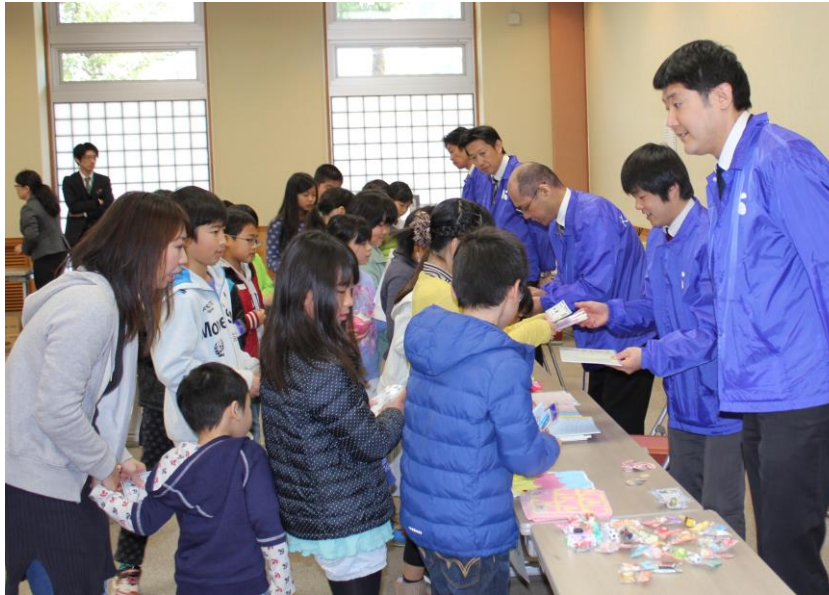
こども金融・科学教室

高知大学との共催による「こどもサッカー教室」や、高知工業高等専門学校との共催による「こども金融・科学教室」なども毎年継続して実施しており、これらの活動を通じて、次世代育成支援や地域貢献活動にも積極的に取り組んでおります。