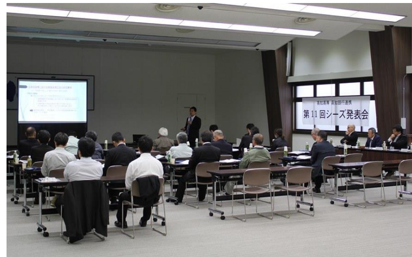
産学連携による「シーズ発表会」