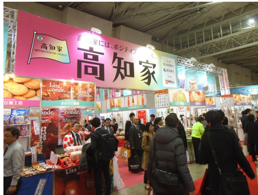
商談会：「スーパーマーケット・トレードショー2017」

また、ビジネス情報ネットワークシステムの「営業サポート情報」をソリューション提案ツールとして積極的に活用しているほか、お取引先の多様なニーズにお応えしていくために、ビジネスマッチング等に関する外部機関との業務提携によるサポートを有効に活用したコンサルティング機能の強化に取り組んでおります。