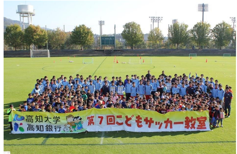
こどもサッカー教室