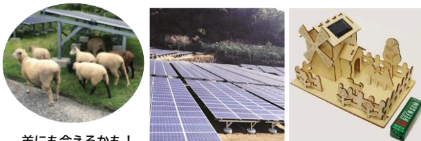
羊にも会えるかも!