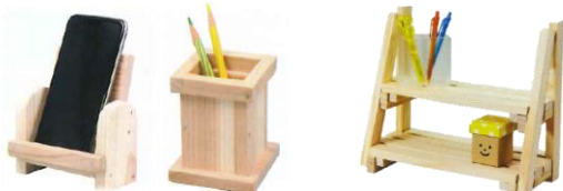
スマホスタンド・ペンスタンド